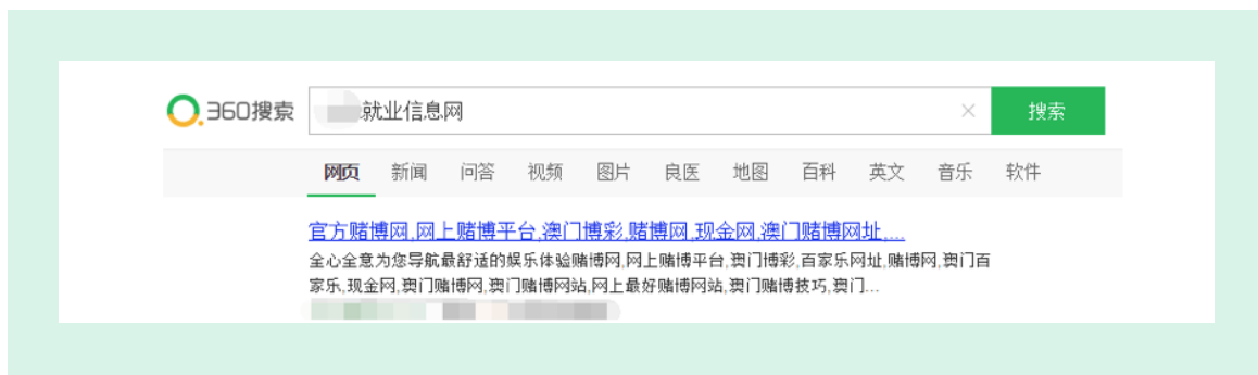
图1 网站被黑导致标题摘要被篡改