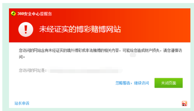
图2 访问被黑站点时被提示风险